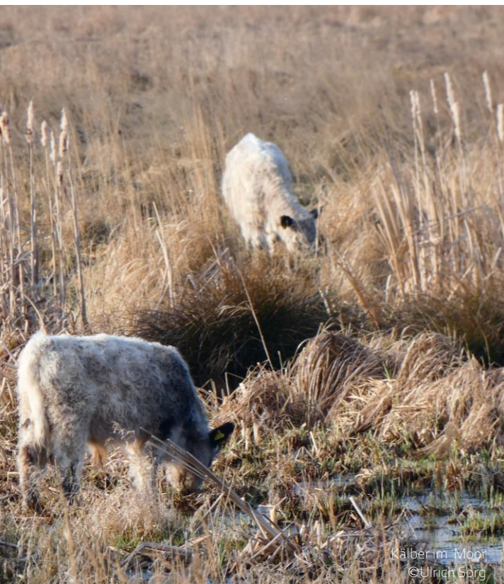
Kälber im Moor

Für die Unterstützung bedanken wir uns bei Ihnen mit einer Koordinate, wo sich das von Ihnen unterstützte Projekt befindet und dem von unabhängigen Dritten zertifizierten Klimabeitrag, welchen wir mit Ihrer Hilfe leisten konnten.