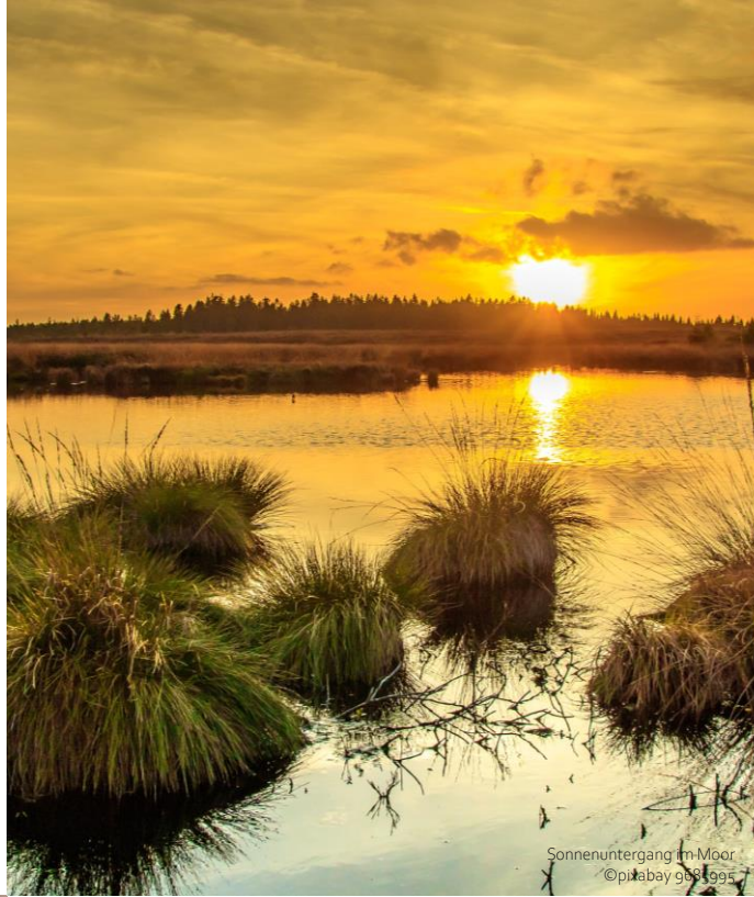
Sonnenuntergang im Moor

Ein Hektar Moorschutz vermeidet jedes Jahr ca. 20 Tonnen Treibhausgase. Das entspricht einer Fahrleistung von ca. 200.000 km im PKW pro Jahr! Damit ist das Moor einer der effizientesten Klimaschützer. Gleichzeitig läuft uns die Zeit davon. Durch die Trockenlegung von Mooren verschwinden diese allmählich aus der Landschaft. Doch das muss nicht so bleiben. Nach dem Motto sieben auf einen Streich schafft der Moorschutz Linderung bei Dürren, Hochwasserschutz, Bodenerhalt, Grundwasserneubildung, Naturschutz, Nutzung im Einklang mit der Natur und schließlich Klimaschutz.